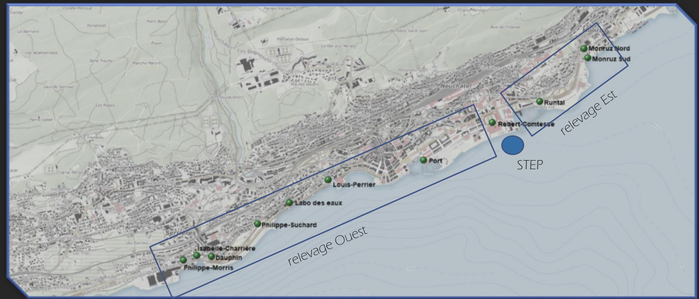
Relevage Ouest en heure de pompage par jour